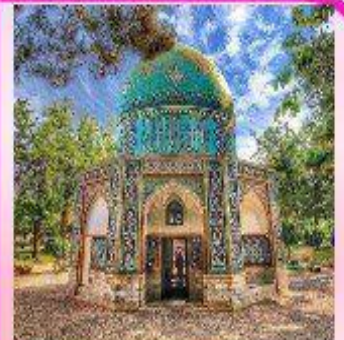
۱۵ فروردین روز بزرگداشت شیخ فریدالدین عطار نیشابوری، عارفه شاعر، طبیب و دانشمند بزرگ.

کلاس‌های ترم از یکشنبه 14 فروردین تنها به صورت حضوری برگزار می‌شود. نهمین اختتامیه مسابقات قرآنی ترم نور بوسسه فرهنگی آموزشی امام حسین (ع) با حضور دانش‌آموزان قرآنی در محل حسینیه سیدالشهدا اهدا جوایز منتخبین قرآنی. کسب نوبه برتر ترمین مسابقات ربه دانش آموزان عزیز قرآنی تبریک می‌گوییم.